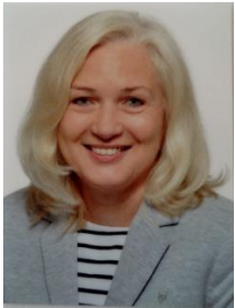
Bringfriede Bunte Sozialpädagogik, Niederdeutsch