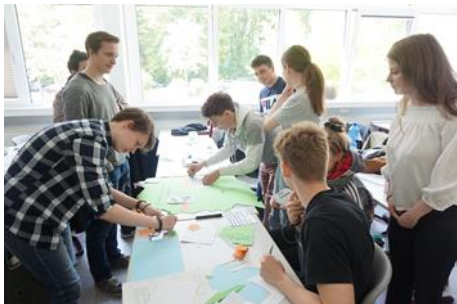
Überall wurden eifrig Plakate erstellt

Zehn Tage später – am 23. Mai, dem 70. Jahrestag der Verkündigung des Grundgesetzes – war nahezu die gesamte Schule in Schleswig am „Tag der Demokratie“ beteiligt. Es gab einen Plakatwettbewerb der Klassen zur Frage: „Was haben wir davon, in einer Demokratie zu leben?“ Vier Stunden hatten die Schülerinnen und Schüler Zeit, sich mit der Frage auseinanderzusetzen und dann dazu ein Plakat